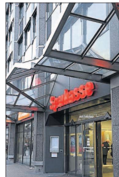
Zum zweiten Mal innerhalb von etwas mehr als vier Wochen ausgeraubt: die Sparkasse am Mannheimer Paradeplatz.

Der Bankräuber soll etwa 30 Jahre alt und 1,65 bis 1,70 Meter groß sein. Er trug laut Zeugenberichten eine dunkle Jacke, blaue Jeans, weiße Schuhe und eine schwarze Baseballmütze. Gesprochen haben soll er mit russischem Akzent. Hinweise zu dem Überfall nimmt die Polizei unter Telefon 0621/1740 entgegen. (os)